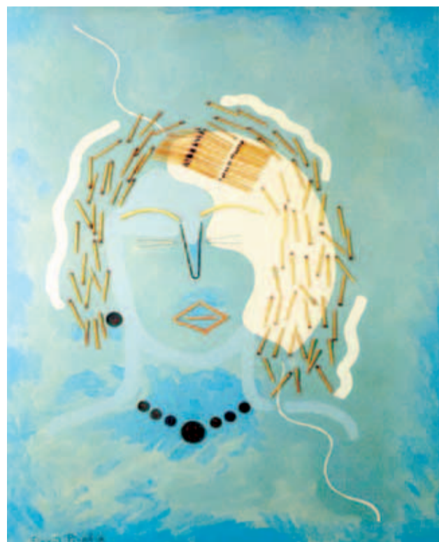
Francis Picabia: Žena sa šibicama